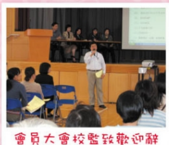
會員大會校監致歡迎辭