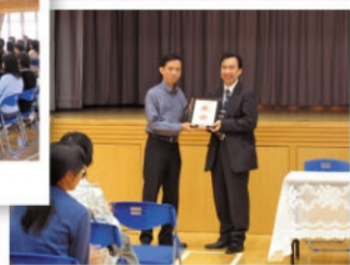
宗教會主席致送紀念品

家教會資源中心設於校舍地下層靠近操場的一個房間。感謝校方撥出這地方給我們。房間雖然不大，卻提供給我們家長一個落腳的地方。當家長協助小朋友進膳後，可在這裡休息或看書及雜誌。這裡還有大家可借閱的參考資料，也可讓家長互相交流手工藝，以增值自己。